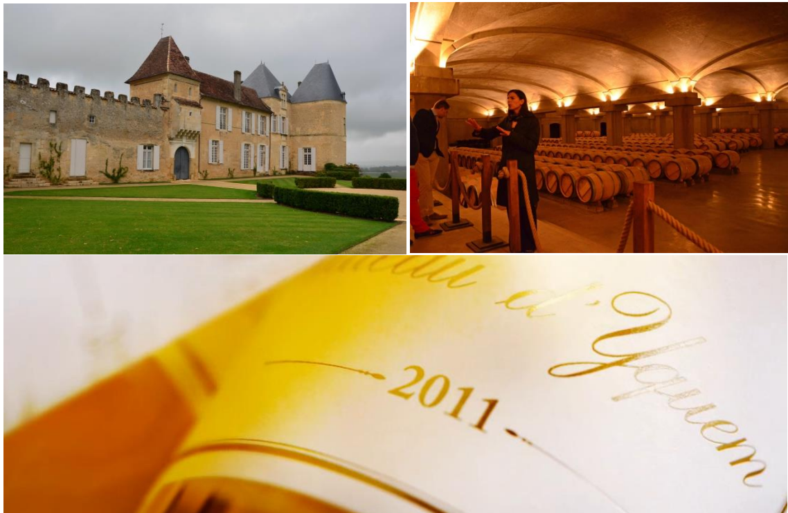
Chateau d'Yquem, Premier Grand Cru Classé Sauternes... onovertroffen!